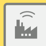
ГУДКИ ПРЕДПРИЯТИЙ И ТРАНСПОРТНЫХ СРЕДСТВ